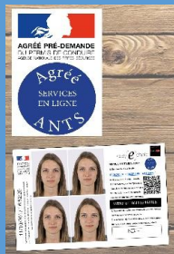
PHOTO D'IDENTITE AGREE